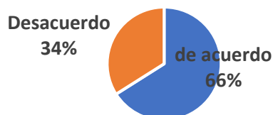
Resultado de Colegio: Consulta a apoderados respecto a la flexibilización de la JEC